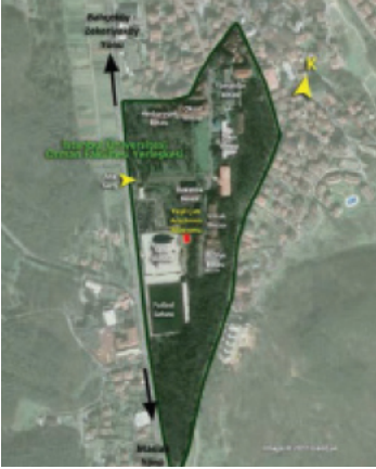
Şekil 1. Deneme Alanının (İÜYÇAP) konumu

Deneme alanı, İstanbul'un Kuzey kesiminde, Belgrad Ormanları'nın hemen yakınında, deniz seviyesinden yaklaşık 100 metre yukarıda yer almaktadır. Deneme alanı İ.Ü. Orman Fakültesi yerleşkesi içerisinde konumlandırılmıştır (Şekil-1).