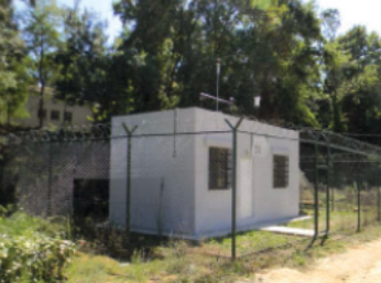
Şekil 2. Deneme sahasının görünümü